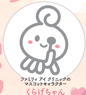
ファミリーアイクリニックの マスコットキャラクター くらげちゃん